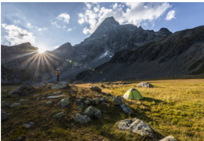
OUI > perception d'une ambiance de lever ou coucher du jour qui correspond à une installation de 19h à 9h

Message clé à retenir : Partager son expérience sur les réseaux sociaux implique une vraie responsabilité car tout contenu attractif attire d'autres bivouaqueurs après soi, il est donc essentiel de communiquer les bonnes informations.