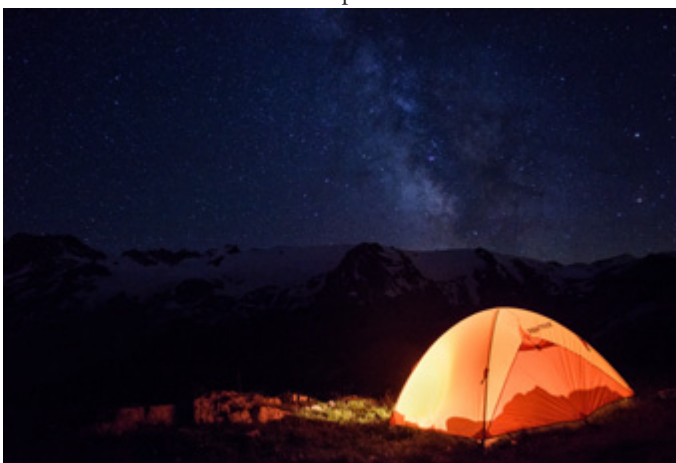
OUI > perception d'une ambiance nocturne qui correspond à une installation de 19h à 9h