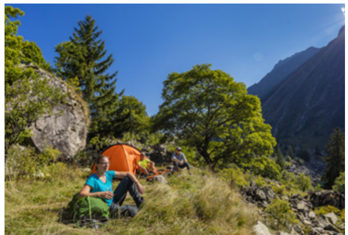
NON > perception d'une ambiance de pleine journée lorsque le bivouac est interdit en dehors des horaires 19h-9h