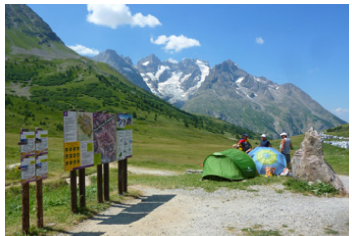
NON > installation à moins d'une heure de marche des limites du cœur de parc et en dehors des horaires autorisés