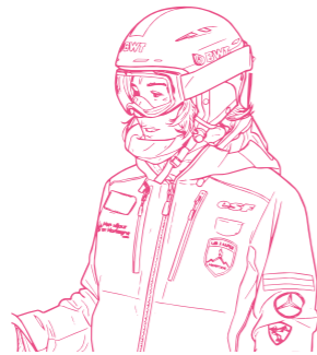
Céline, LA MONITRICE DE SKI

Hi, I'm Victor, and I'm a snow groomer. I drive a big machine called a snow groomer to make the ski slopes nice and smooth. I work at night, when there are no skiers left, and prepare the snow so that everything is looking good and safe for the next day. I'm a bit like the magician of the slopes!